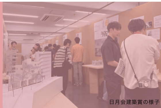
日月会建築賞の様子