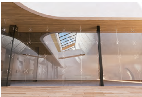
満月賞「MAU P3 Hall」富士本峻